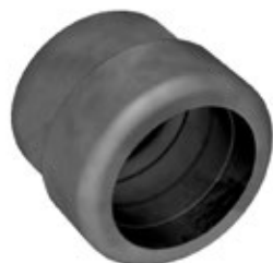
-FC Guarnizione a "fungo" corta.

Infatti, tutti i tipi di Pressacavi in metallo e in plastica - serie "AGRO" sono fornibili soltanto con le guarnizioni indicate nelle tabelle. Su richiesta, però, è possibile realizzare guarnizioni specifiche per la risoluzione di qualsiasi problematica.