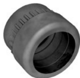
-FCP Guarnizione a "fungo" corta, per pressacavi "Progress".