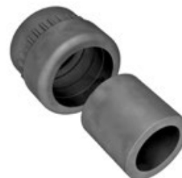
-FC2P Guarnizione a "fungo" corta e a due elementi, per pressacavi "Progress".