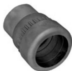
-FLP Guarnizione a "fungo" lunga, per pressacavi "Progress".