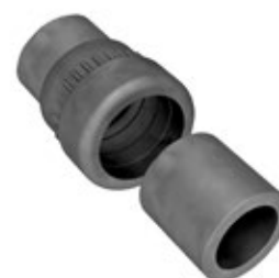
-FL2P Guarnizione a "fungo" lunga e a due elementi, per pressacavi "Progress".