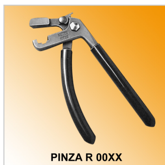
PINZA R 00XX

Il disegno è indicativo e le proporzioni potrebbero non corrispondere alle dimensioni in tabella o reali.